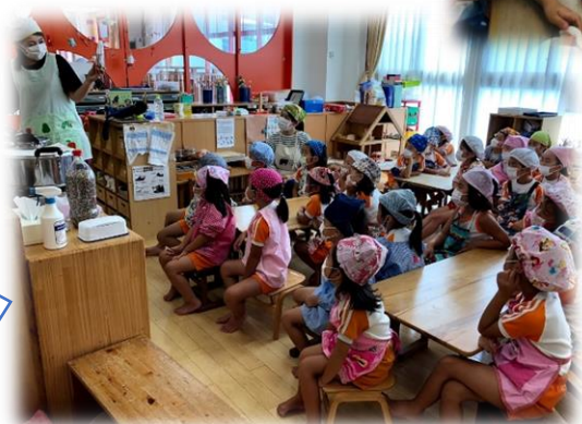
～夏野菜カレー作り～